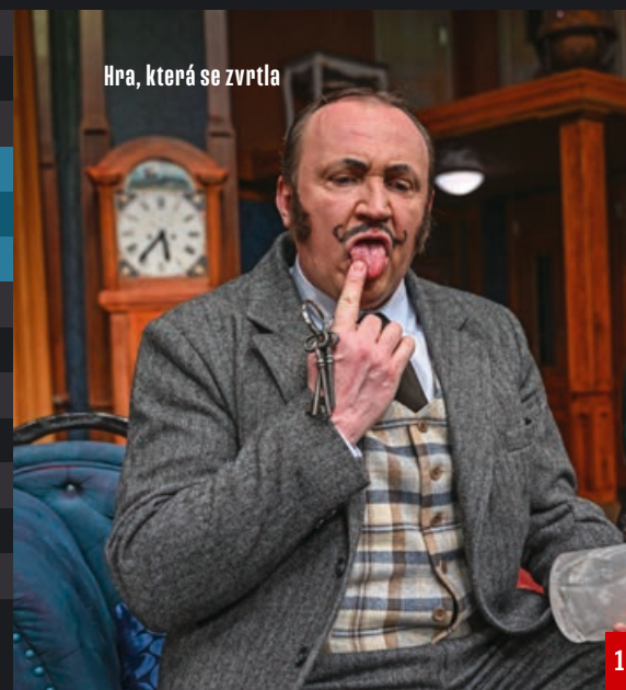
Hra, která se zvrtila